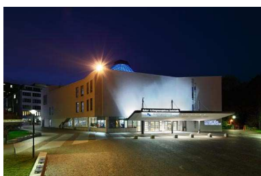
Haupteingang des Hegel-Saals bei Nacht